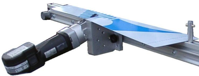
Optionale Längsschneideeinrichtung K1-LSE zum Spalten von Coils (Abb. mit optionaler Schere)