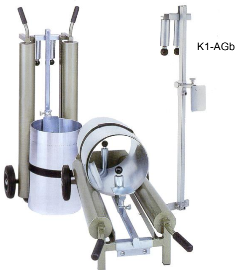
K1-AG mit K1-AGb